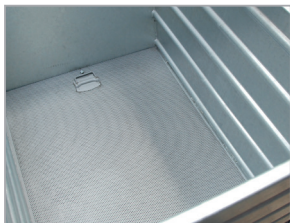
Double-fond en tôle perforée (BSL)